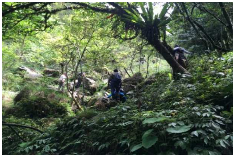
植生復育林相豐富