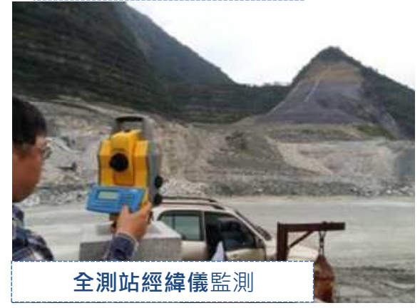
全測站經緯儀監測