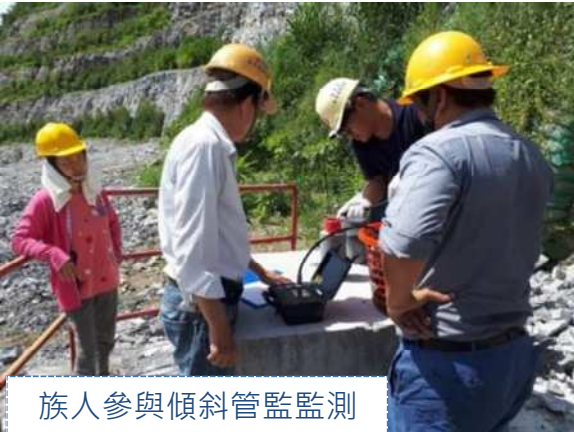
族人參與傾斜管監測