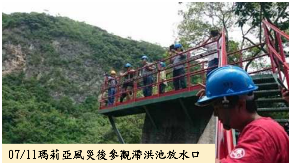
07/11瑪莉亞風災後參觀滯洪池放水口