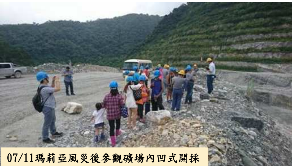
07/11瑪莉亞風災後參觀礦場內凹式開採