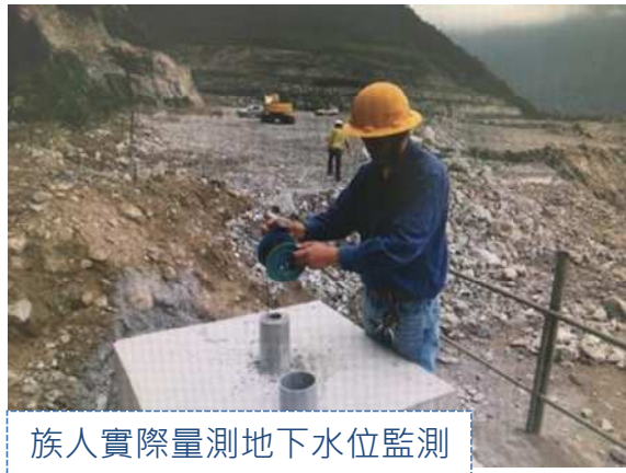
族人實際量測地下水位監測