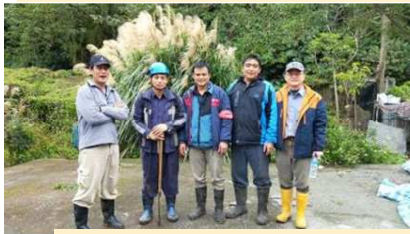
0206地震後邀村民勘查10鄰上方邊坡