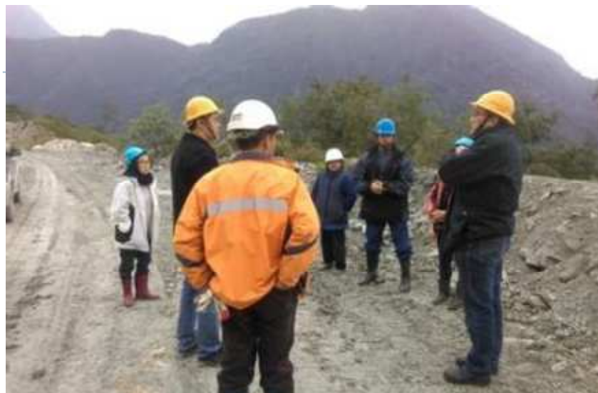
0206地震後邀村民現勘礦場，無任何落石崩塌